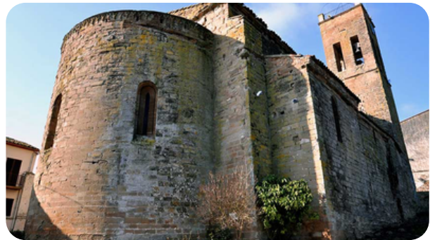
IGLESIA DE SANT PERE