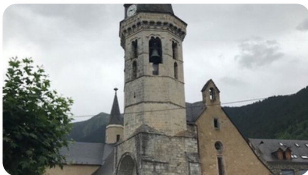
IGLESIA DE SANT MIQUEL