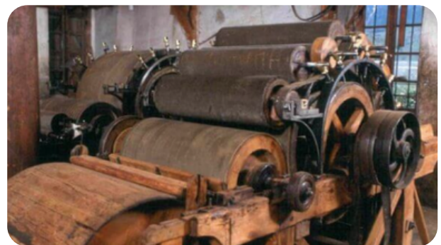
MUSEO DE LA LANA Precio: 2€