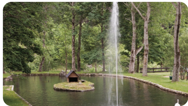
RUTA POR LOS JARDINES Y VISITA A LAS FUENTES