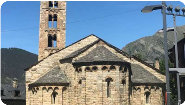
IGLESIA ROMÁNICA DE SANTA MARIA

Está situado en el fondo del valle de Boí, elevado junto a levante. El motor de su economía es actualmente el turismo.