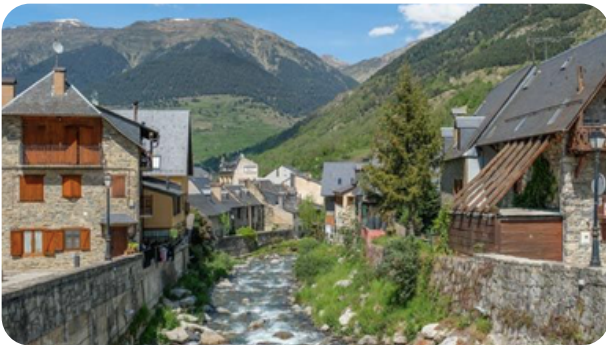
PASEO POR EL CENTRO HISTÓRICO

Viella es la capital del Valle de Aran y jefe del municipio de Vielha e Mijaran y del terçó de Castièro. El municipio de Vielha e Mijaran se constituyó en 1970 a raíz de la fusión de Vielha, de Arròs e Vila, Betlan, Escunhau, Gausac y Vilac. Su nombre significa vieja, nombre que se daba a la población principal de un valle en los Pirineos occitanos, que solía ser la más antigua.