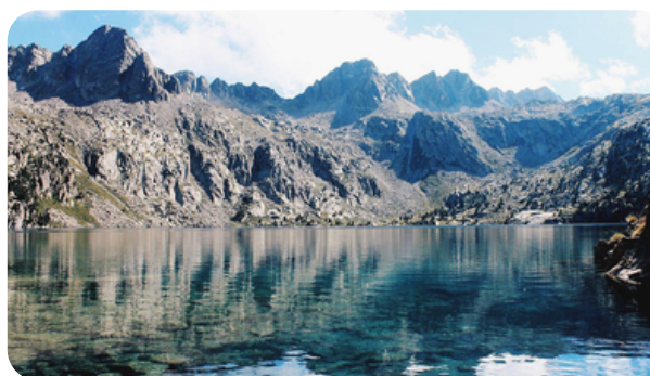
PARQUE NACIONAL DE AIGÜESTORTES