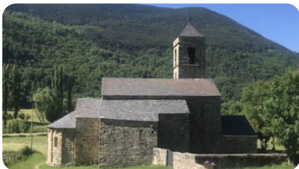
IGLESIA SANT FELIU DE BARRUERA Precio: 2€

Barruera es un pueblo situado en el municipio del Valle de Boí, en la Alta Ribagorça, que dio nombre al municipio hasta 1996. Está situado en la zona axial pirenaica, a la derecha del Noguera de Tor. También era el núcleo principal del antiguo término del mismo nombre, el cual, conjuntamente con el antiguo término de Durro, forman el actual municipio de la Vall de Boí.