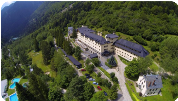
CENTRO TERMAL CALDES DE BOÍ

Caldes de Boí es un santuario con un balneario y una casería anexa de la comarca de la Alta Ribagorça, construida alrededor del balneario, en el municipio del Valle de Boí, dentro del antiguo término de Barruera. Está situado a 1.470 metros de altitud, a la derecha del Noguera de Tor. En 2006 tenía 3 habitantes, aunque la presencia de dos hoteles y un centro termal hace que habitualmente habitan más personas, aunque no de forma permanente.