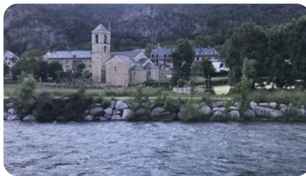
RUTA SALENCAR DE BARRUERA Aprox. 1 hora (ida y vuelta)