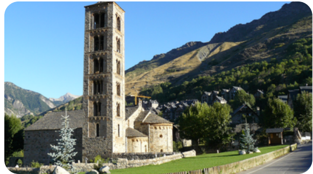
IGLESIA DE SANT CLIMENT DE TAÜLL