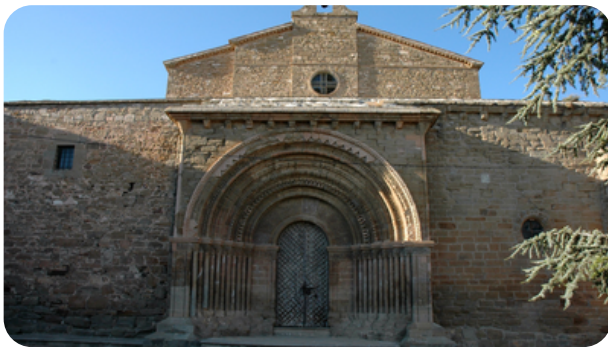
SANTA MARIA DEL CASTELL

Cubells es una villa y municipio de Cataluña situado en la comarca de la Noguera, en el Marquesat. El municipio de Cubells, de una extensión de 39,17 km 2 , está situado en las vertientes meridionales de una alineación montañosa que está formada por la Sierra Carbonera y la de Boada.