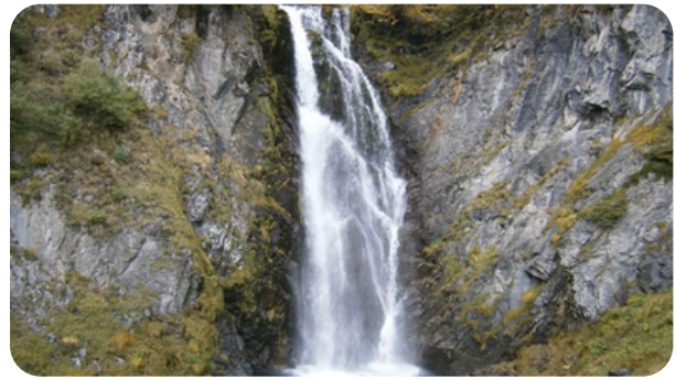
CASCADA SAUT DETH PISH