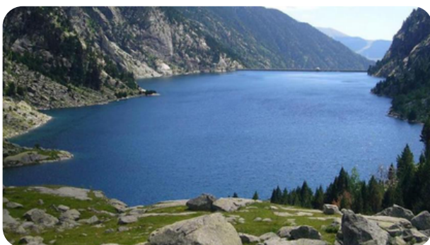
EMBALSE DE CAVALLERS