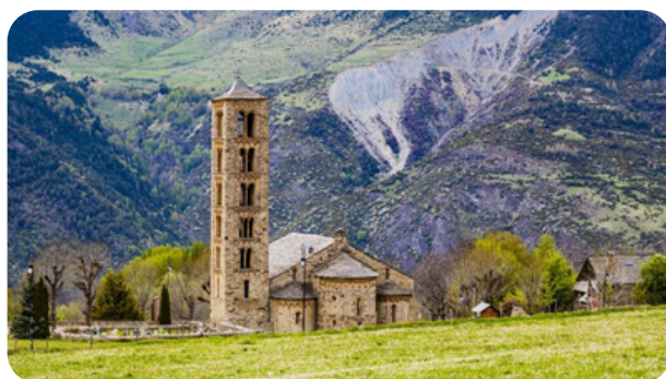
IGLESIAS ROMÁNICAS DE LA VALL DE BOÍ