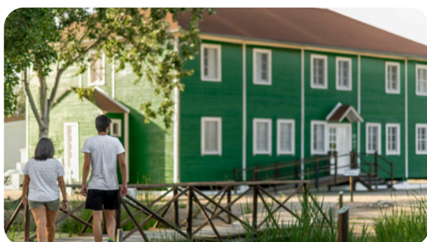
LA CASA DE FUSTA