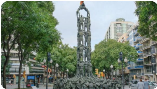
LA RAMBLA NOVA