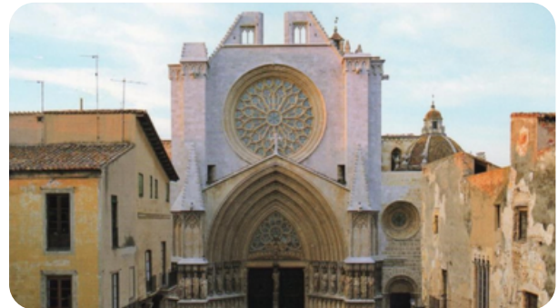
CATEDRAL DE TARRAGONA