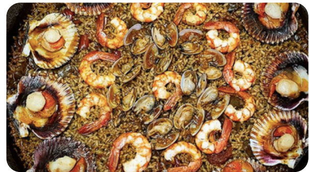
COMER UN BUEN ARROZ