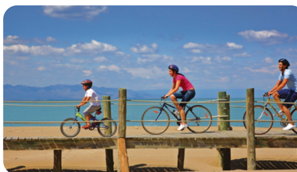
RUTAS EN BICICLETA