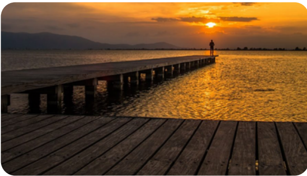
PLAYA DEL TRABUCADOR Sant Carles de la Ràpita