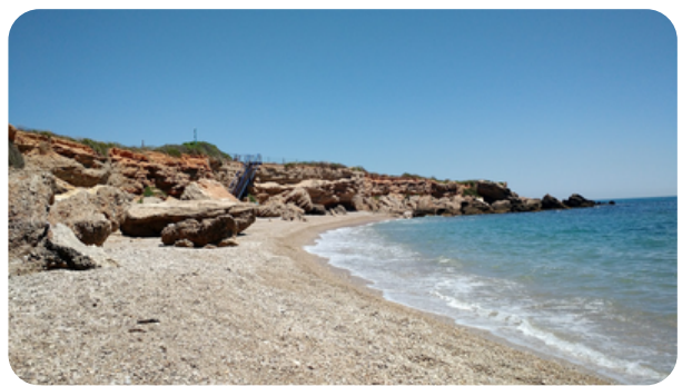
PLAYA SOL DE RIU