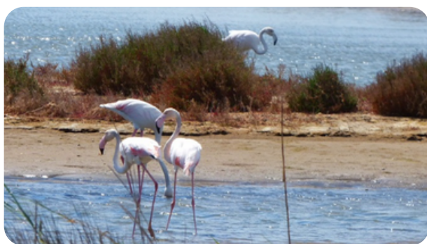
AVISTAMIENTO DE AVES

El delta del Ebro nos ofrece un marco de naturaleza incomparable, único y singular. Es un paisaje de gran riqueza biológica que acoge una diversidad faunística y florística de un valor incalculable. Con 320 km 2 de superficie, constituye el hábitat acuático más extenso de las tierras catalanas y representa un enclave de vital importancia en las zonas húmedas del Mediterráneo. La Generalitat constituyó, en 1983, el Parque Natural del Delta del Ebro.