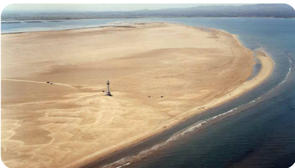
PLAYA PUNTA DEL FANGAR