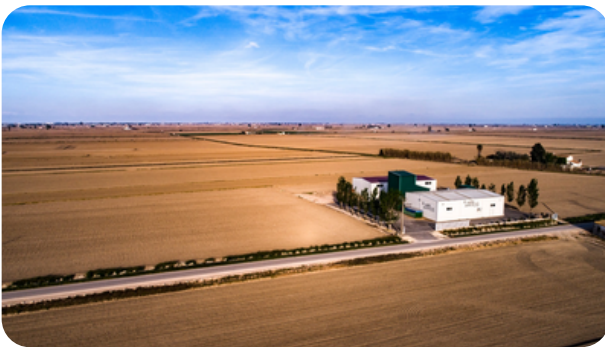
MOLINOS ARROCEROS: "Lo nostre arròs" hace visitas guiadas al molino