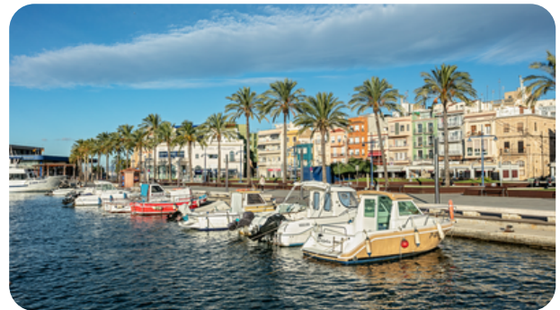
BARRIO DEL SERRALLO