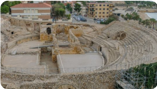
ANFITEATRO Y CIRCO ROMANO Precio: 3,30€

Tarragona es una ciudad del sur de Cataluña, capital de la comarca del Tarragonés y de la provincia de Tarragona. Con una población de 135.436 habitantes (2021), es la ciudad más poblada de la comarca del Tarragonès, de la región del Camp de Tarragona y es la séptima ciudad más poblada de Cataluña.