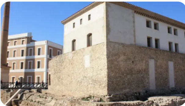
CASTILLO DE AMPOSTA

Amposta es una ciudad de Cataluña, capital de la comarca del Montsià, en el delta del Ebro. Se encuentra a orillas del río Ebro. En su actividad económica destaca la agricultura con la producción de arroz.